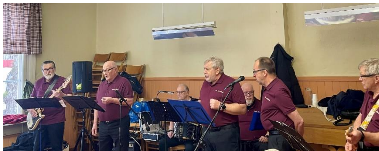
Vanhaa Viiniä yhtye